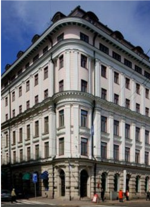
Eteläranta 12, Helsinki